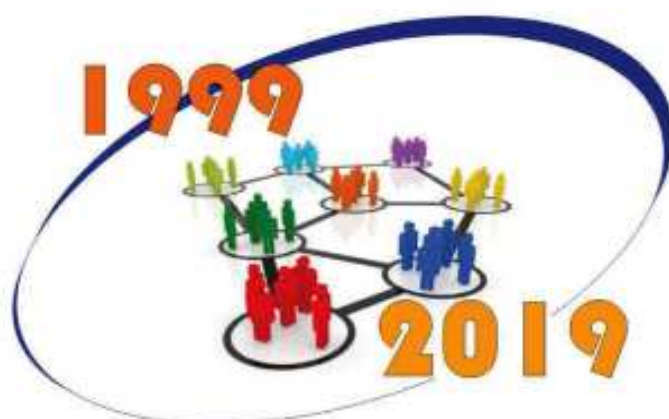
Tavola rotonda sul tema L'AUTONOMIA SCOLASTICA COMPIE 20 ANNI LO STATO DELL'ARTE FRA COERENZE, CONTRADDIZIONI E CONTINGENZE